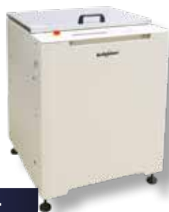
SK 1100 T

Du large volume d'échantillon à la moyenne production