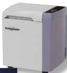
SK 300 S2

Utilisation facile et compacte en laboratoire