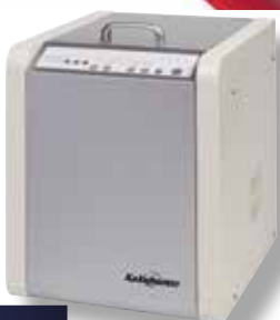
SK 350 T2