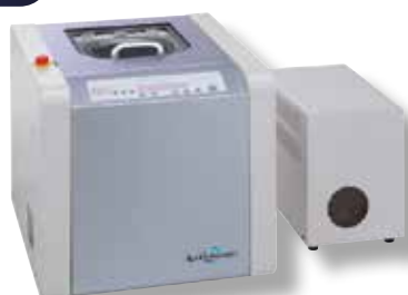
SK 350 TV/